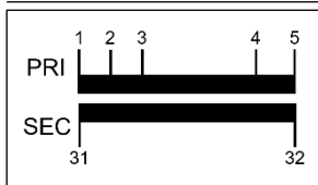
Tabla de conexión